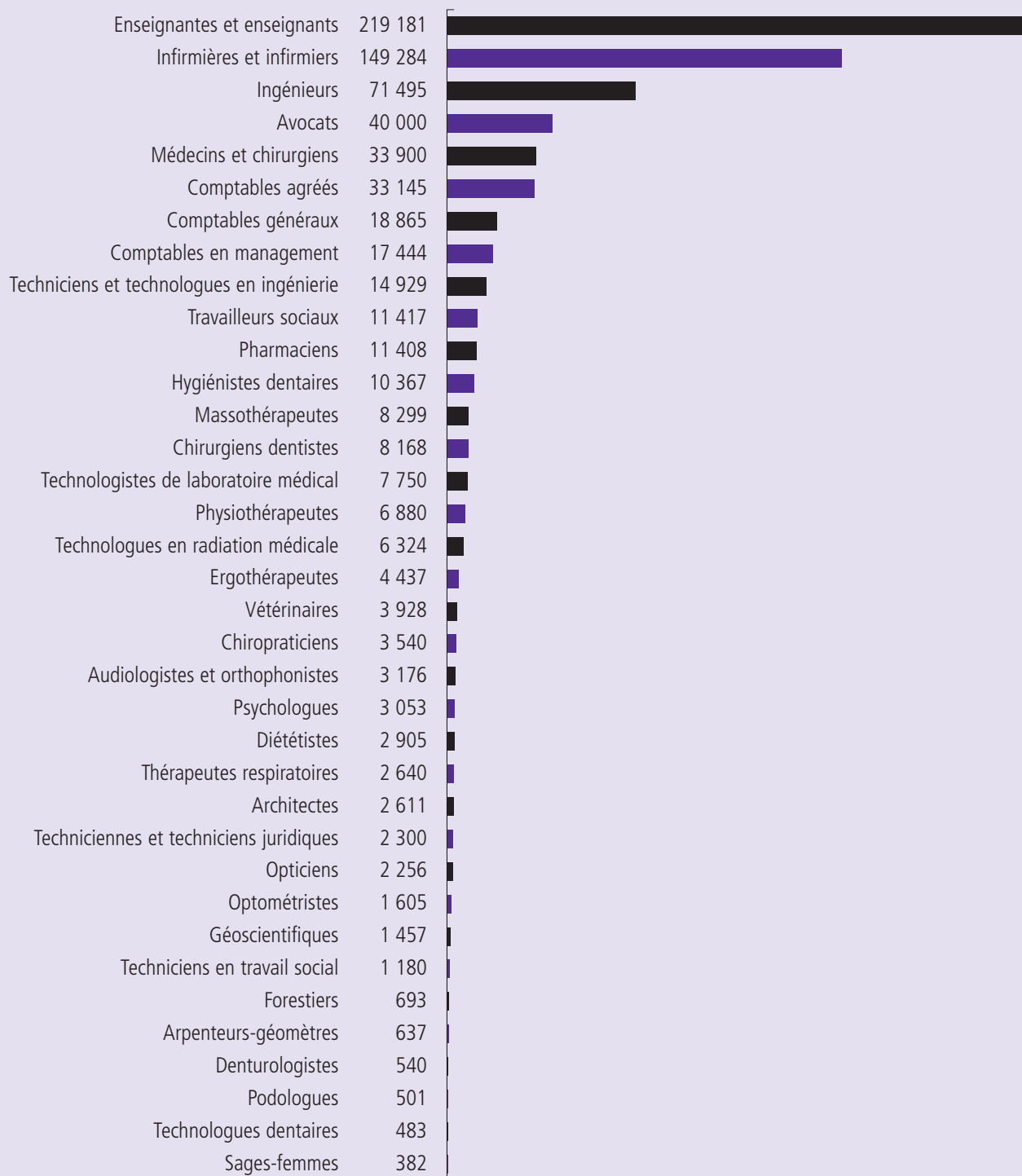
Figure 2. Nombre de membres des professions réglementées en Ontario par profession, en 2008